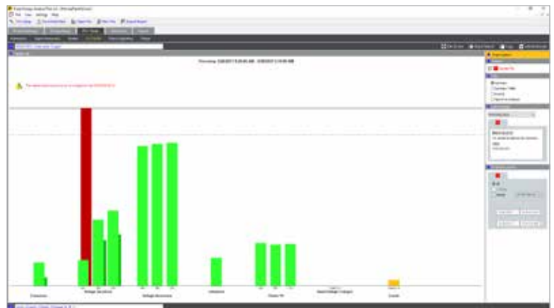
Fluke Energy Analyze Plus: Übersicht über den Zustand der Netzqualität