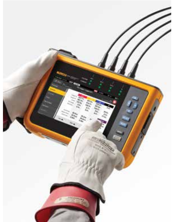
Bequeme Navigation auf dem großen Farb-Touchscreen

Beim Herunterladen von Daten aus den Netzqualitätsanalysatoren der Fluke Serie 1770 kann das mitgelieferte Softwarepaket Energy Analyze Plus statistische Daten zur gemessenen Spannung und zu Stromüberschwingungen mit verschiedenen Normen wie EN 50160 oder IEEE 519 vergleichen und so ermitteln, ob sie die Konformitätsgrenzen überschreiten. Mit dieser leistungsstarken Funktion für die vorausschauende Instandhaltung lassen sich Stromüberschwingungen beobachten, bevor eine Verzerrung der Spannung auftritt. So können Sie unerwartete Fehler oder Konformitätsverstöße verhindern und die Systemverfügbarkeit verbessern. Die Verbreitung von Lasten und Stromversorgungen mit Wechselrichtern macht es immer wichtiger, die Stromüberschwingungen unter Kontrolle zu halten, um eine zuverlässige Netzqualität zu gewährleisten und Systemausfallzeiten zu vermeiden.