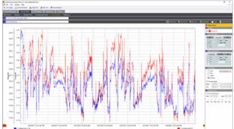
Fluke Energy Analyze Plus: Registerkarte Energieverbrauchsstudie