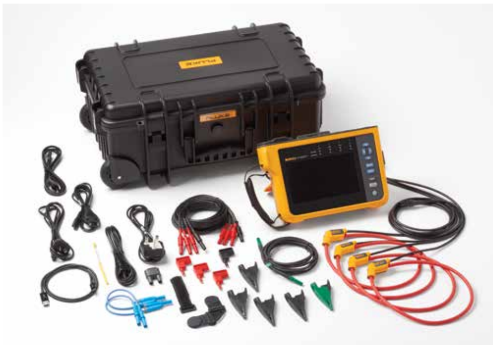
Netzqualitätsanalysator Fluke 1777. Hinweis: Die enthaltenen Artikel variieren je nach Modell und sind in der Tabelle Bestellinformationen aufgeführt.