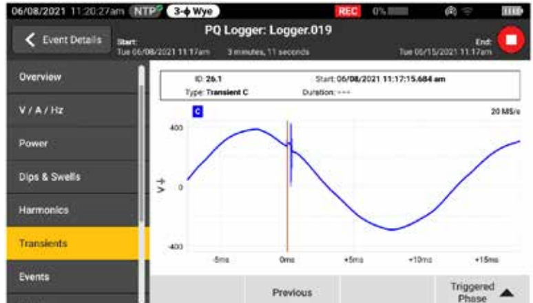
Schnellere Problembeseitigung durch Anzeige von Transienten in Echtzeit, während die Protokollierung noch läuft

Transienten wirken sich tagtäglich negativ auf ansonsten einwandfreie Systeme aus und ihr Potenzial zur Schädigung von Anlagen darf nicht unterschätzt werden. Unabhängig davon, ob in Ihrem System Impuls- oder Schwingungstransienten auftreten, können die Ergebnisse verheerend sein und Probleme verursachen, die von beschädigter Isolierung bis hin zu Totalausfällen von Anlagen reichen. Fluke 1775 und Fluke 1777 verfügen über innovative Technologie zur Transientenerfassung, mit der Sie schnelle Spannungstransienten eindeutig erkennen können und über die nötigen Daten verfügen, um ihre Entstehung zu vermeiden. Der Netzqualitätsanalysator Fluke 1775 hat eine Abtastrate von 1 MHz zur Erfassung schneller Transienten, das Modell Fluke 1777 von 20 MHz, um auch die schnellsten Transienten mit hoher Detailgenauigkeit zu erfassen.