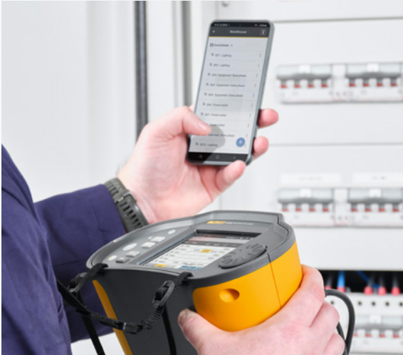
Weniger manuelle Dateneingabe und Aufzeichnungen