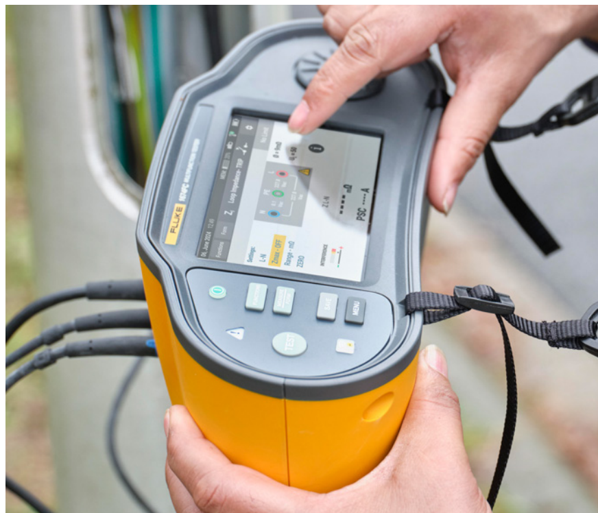
Schnelle Navigation mit Farb-Touchscreen und taktilem Drehknopf

Mit der Serie 1670 führen Sie die erforderlichen Prüfungen schneller durch, reduzieren den Zeitaufwand für die Dokumentation und können sich dabei auf die gesammelten Daten verlassen.