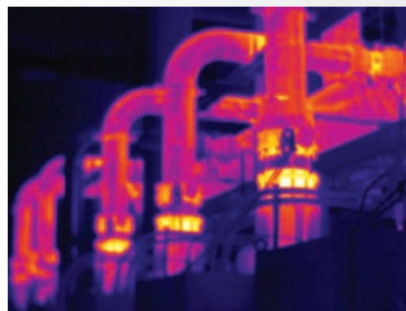
Manueller Fokus – nur das Rohr im Vordergrund ist richtig fokussiert

Jedes Objekt 100 %-ig fokussiert. Nah und fern. MultiSharp™-Fokus.