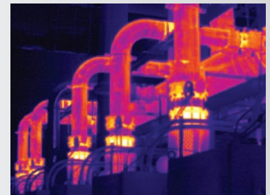
MultiSharp™-Fokus erzeugt ein im gesamten Gesichtsfeld fokussiertes Wärmebild.