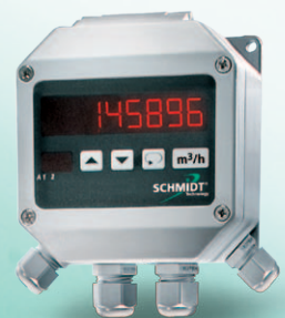
LED-Messwertanzeige MD 10.010 / 015 im Wandgehäuse