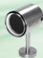
PYROTHERM CS F35 bis F150 Feste Temperaturen: 35 °C bis 150 °C