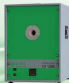
PYROTHERM CS 1500 Temperaturbereich: 300 °C bis 1500 °C