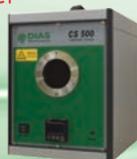
PYROTHERM CS 500 Temperaturbereich: 50 °C bis 500 °C