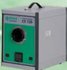
PYROTHERM CS 120 Temperaturbereich: -15 °C bis 120 °C