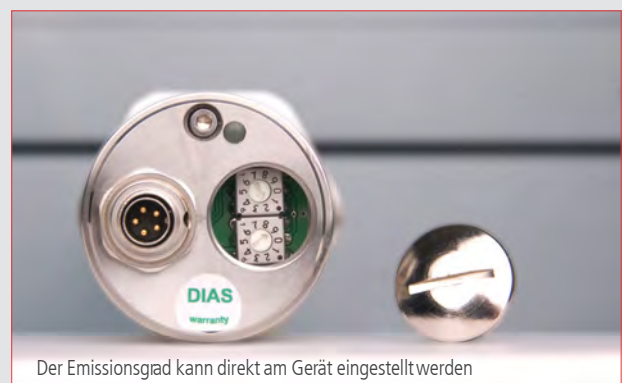
Der Emissionsgrad kann direkt am Gerät eingestellt werden