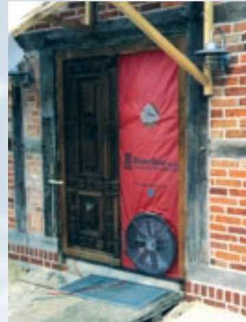
BlowerDoor-Messung im Rahmen einer Fachwerksanierung.

Von einem luftdichten Gebäude spricht man, wenn die Luft im Gebäude unter Prüfbedingungen nicht häufiger als drei Mal pro Stunde ausgetauscht wird. Wird eine Lüftungsanlage im Haus installiert, darf der Luftwechsel gem. Energieeinsparverordnung (EnEV 2002, Anhang 4 Nr. 2) bei Prüfdruck max. 1,5 m 3 pro Stunde betragen. „Luftdicht“ bedeutet dabei nicht das totale luftdichte Verschließen, sondern meint die Vermeidung ungewollter Leckagen in der Gebäudehülle. Denn: Warmluft strömt durch Fugen nach außen – das kostet Energie. Gleichzeitig transportiert die warme Luft Feuchtigkeit, die sich in der Außenwand des Gebäudes abkühlt und kondensiert; das entstehende Tauwasser kann zu schwerwiegenden Bauschäden führen. Dringt Außenluft durch Fugen ins Gebäudeinnere, werden zudem Allergene aus der Dämmung und Staubpartikel in das Haus transportiert; gesundheitliche Beeinträchtigungen können die Folge sein.