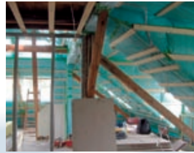
Die luftdichte Ebene ist noch sichtbar (Folie und Holzbauplatte): Der optimale Zeitpunkt für eine BlowerDoor-Messung

BlowerDoor GmbH MessSysteme für Luftdichtheit