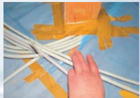
Leckage auf Grund von Kabeldurchdringungen.

Konstruktionsbedingte Leckagen bzw. Undichtheiten treten oft an Anschlüssen und Durchdringungen auf. Hier sollte die Luftdichtheitsschicht insbesondere detailliert geplant werden, um spätere kostenintensive Nachbesserungen zu vermeiden.