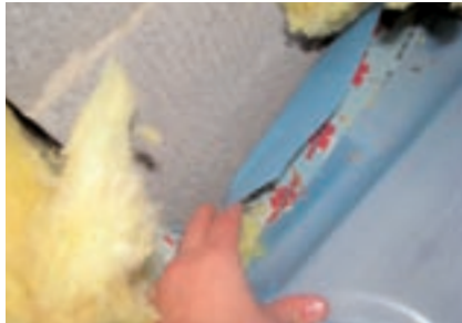
Leckage durch nicht fachgerecht ausgeführte Luftdichtung an einem Schornsteinanschluss.