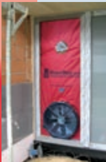
BlowerDoor-Messung eines neu gebauten Einfamilienhauses.

Der Glaube, ein Gebäude müsse Ritzen und Fugen haben, um „natürlich zu atmen“, ist falsch. Ein solcher Luftwechsel erfolgt unkontrolliert, es gelangt zu viel oder zu wenig Frischluft ins Gebäudeinnere; Schadstoffe und Staub aus der Dämmung mischen sich zudem in die Raumluft. Die Lüftung eines Gebäudes sollte daher über das mehrmalige Öffnen der Fenster oder aber durch eine Lüftungsanlage erfolgen.