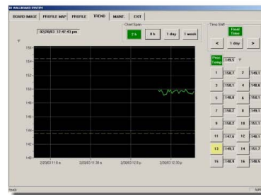
Prozesstemperatur über der Zeit (für 2 h dargestellt)