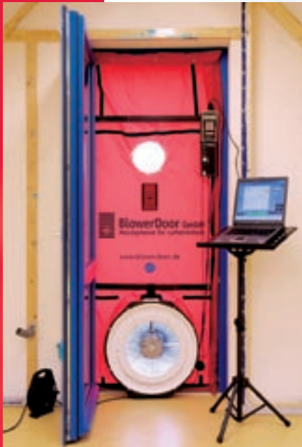
Die BlowerDoor, hier eingebaut in eine Terrassentür, sorgt für gute Bauqualität.